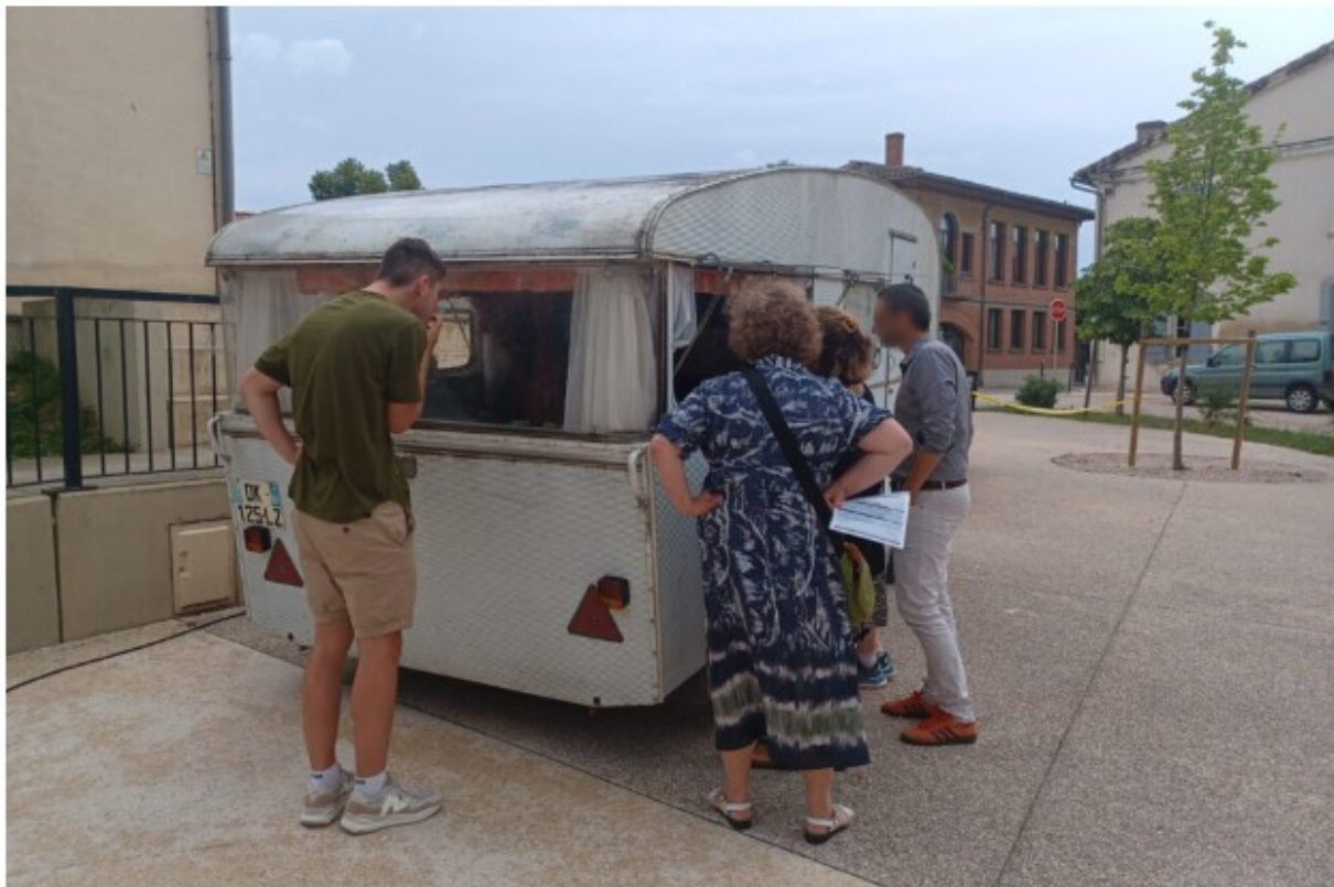
Chaque session d'enquête de la Caravane du Crime dure 1h30.

« Les participants devront former des équipes et poser les bonnes questions, recouper les informations et mettre à profit leur esprit d'observation pour découvrir le coupable, son mobile et son mode opératoire », détaille Pascal Martin, l'auteur.