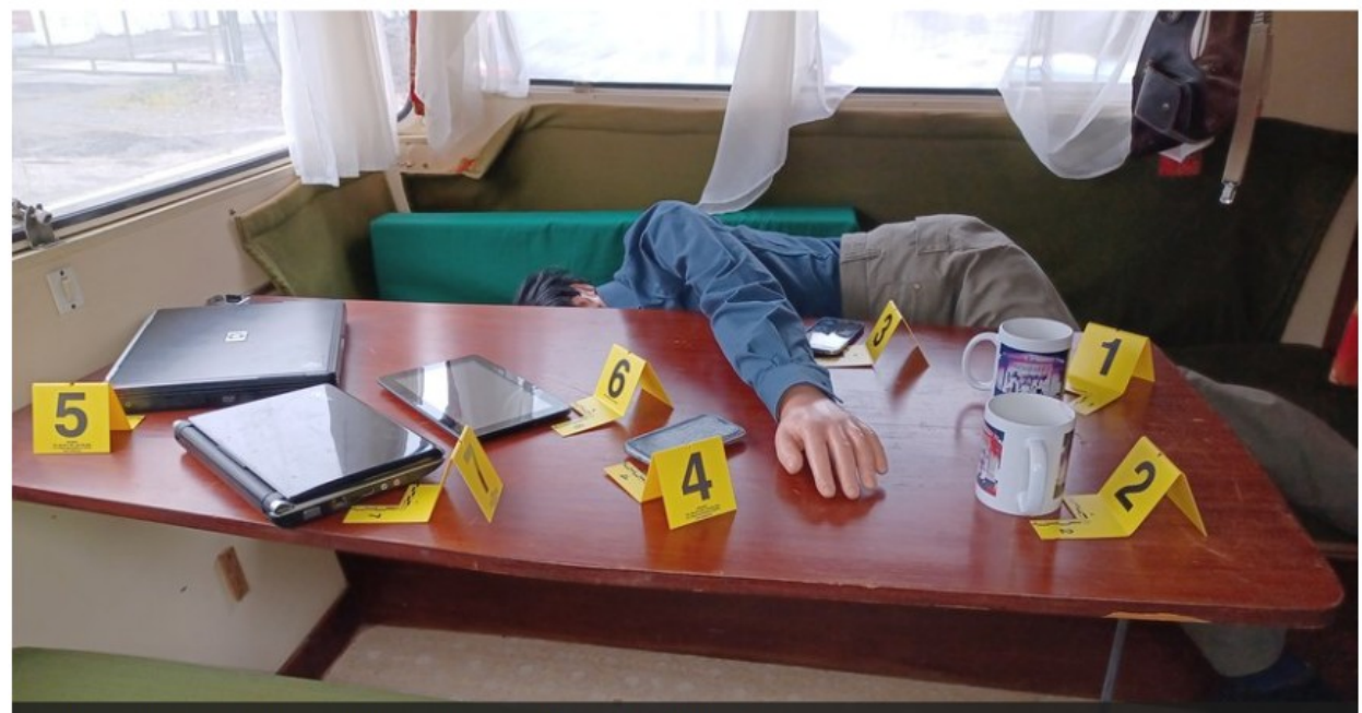
Qui a tué Benjamin Fergeon ? A vous de mener l'enquête.